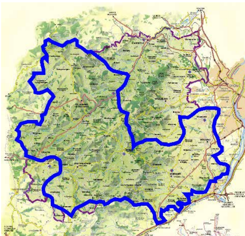
Le périmètre du futur OTI

Si vous êtes adhérents en 2018 à l'un des trois Offices de Tourisme concernés par la fusion vous deviendrez de fait adhérent de l'OTI pour le reste de l'année . Vos contacts habituels à l'Office de Tourisme ne changeront pas non plus pour cette année.